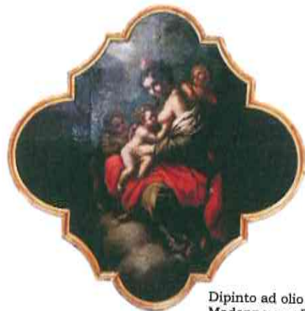
Dipinto ad olio raffigurante Madonna con Bambino e S. Giovanni - F. Giordano - sec. XVII-XVIII (Proprietà Cassa Forense)

La domanda deve essere presentata, a pena di decadenza, a decorrere dal compimento del sesto mese di gravidanza (26esima settimana di gestazione) fino al termine perentorio di 180 giorni dal parto.